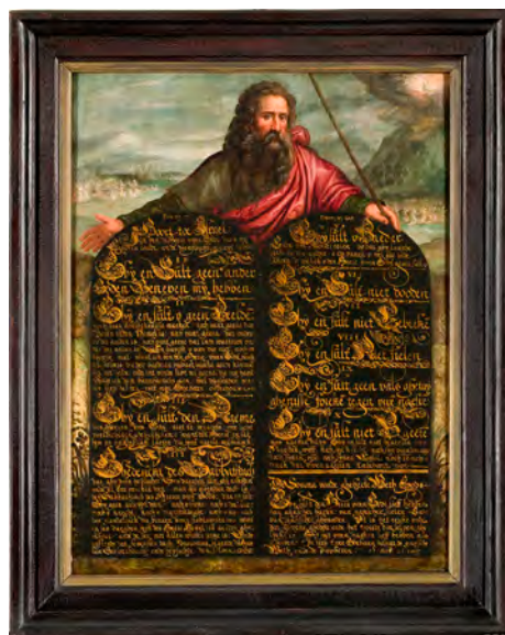
Tiengebodenbord met Mozes Noordelijke Nederlanden, eerste kwart 17e eeuw RMCC s13