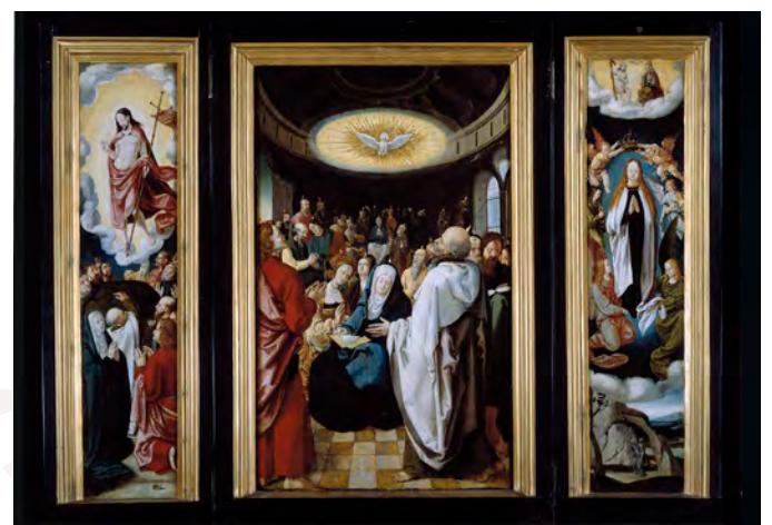
Drieluik met Nederdaling van de Heilige Geest, Hemelvaart van Christus en Maria Tenhemelopneming. Omgeving van Lucas van Leyden, tweede kwart 16e eeuw ABM s114

► Dit schilderij gaat over Pinksteren. Zie je de vlammetjes boven de hoofden van de apostelen? Wat kun je nog meer ontdekken op het schilderij?