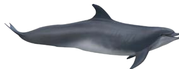
4. Tuimelaar dolfijn